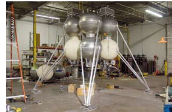
Der „Quad“, die nächste Evolutionsstufe nach „Pixel“ und „Texel“.

Fragt man bei Armadillo an, ob sie einen Investor brauchen, erntet man in der Regel ein fröhliches: „Nö, danke. Wir sind gut finanziert. Aber wenn Sie unbedingt sehr viel Geld bei uns anlegen wollen, dann hören wir uns das gerne an“. Armadillo hat inzwischen knapp ein Dutzend verschiedene Vehikel gebaut und die meisten davon auch schon wieder geschrottet. Ihr grandios simples Design, der modulare Aufbau ihrer Fahrzeuge und das inkrementelle Vorgehen werden ihnen den Erfolg sichern. Von ihnen kann man Großes erwarten. Vor allem wenn sie sich entschließen können, die Sache fulltime durchzuführen (was sie aber erst tun wollen, sobald eine kritische Menge von Aufträgen von außerhalb