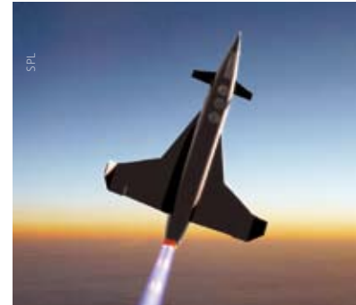
Die Black Sky, portraitiert auf Seite 24 f.

Produkte: Testvehikel Xtreme3042 und Black Sky. Suborbitales Raumfahrzeug Enterprise. Xtreme3042 ist ein Propellerflugzeug mit Klapprotor, das mit einem Raketenmotor ausgerüstet ist, um erste Erfahrungen mit Raketenantrieben zu gewinnen. Erstflug geplant: 2009. Ein Jahr zeitversetzt soll die Black Sky ge-