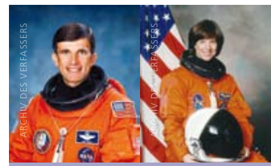
Ron Sega. Bonnie Dunbar.