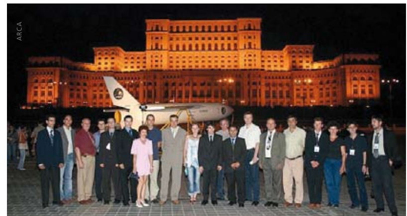
Das ARCA Team vor Ceaușescus Parlamentspalast in Bukarest.